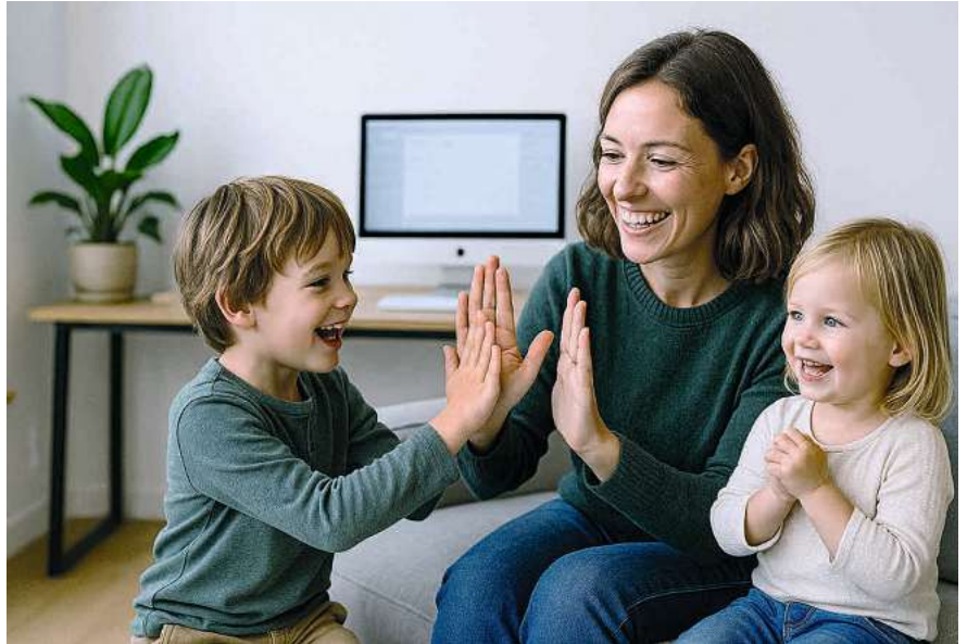
Bei Teilzeit sollten Paare und Familien ihre soziale Absicherung sorgfältig analysieren.

Dem Risiko bei Todesfall sollte man als Familie oder Paar (verheiratet, eingetragene) ebenfalls Aufmerksamkeit schenken. Hier steht die finanzielle Situation der Hinterbliebenen im Fokus. Bei einem Unfalltod greifen die Leistungen von AHV und Unfallversicherung, die – mittels Witwen- oder Witwerrente – zusammen bis zu 90 Prozent des entgangenen Lohn- einkommens der verstorbenen Person decken und so den Einkommensverlust ein Stück weit kompensieren. Bei einem krankheitsbedingten Todesfall fällt die finanzielle Absicherung für die Hinterbliebenen deutlich tiefer aus. Wo Teilzeitpensen im Spiel sind, ist es als Familie oder