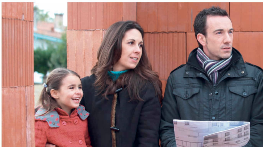
Fällt der Eigenmietwert oder nicht? Die Diskussion ist noch im Gang.

Steuerabzüge (Hypothekarzinsen, Unterhaltskosten u. a.) ebenfalls erhalten bleiben sollen. Im Nationalrat wurde rasch klar, dass der Ansatz, «den Fünfer und das Weggli» zu wollen, nicht mehrheitsfähig ist. Nun geht das Geschäft zurück an die Kommission. Mit raschen Änderungen in Sachen Eigenmietwert ist also vorderhand nicht zu rechnen. ■