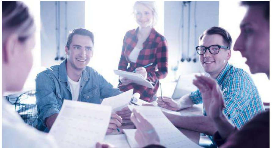
Aktionärbindungsvertrag: ein sinnvolles Instrument, um in guten Zeiten vorausschauende Regelungen für schwierige Phasen zu definieren.

Fast alle Aktionärbindungsverträge sehen Veräusserungsbeschränkungen vor, gerade in Familienbetrieben und Aktiengesellschaften mit wenigen Aktionären. Beispielsweise erwirbt man mit einem Kaufrecht das Recht, Aktien zu erwerben, ohne dass die Zustimmung der anderen Partei erforderlich wäre. Das kann sinnvoll sein, wenn ein Unternehmensaktionär bei der Gründung nicht das ganze Aktienkapital aufbringen kann, aber später den Anlegeraktionär auskaufen will. Vorhandrechte wiederum verpflichten dazu, seine Aktien der anderen Partei anzubieten, bevor ein Vertrag mit einem Dritten abgeschlossen wird. Ein Vorkaufsrecht berechtigt dazu, anstelle eines Dritten zu den Konditionen,