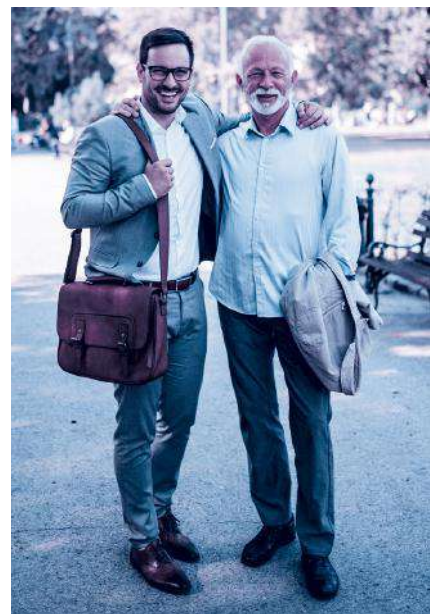
Finanzierung nach dem Umlageverfahren: zuerst einzahlen, später beziehen.