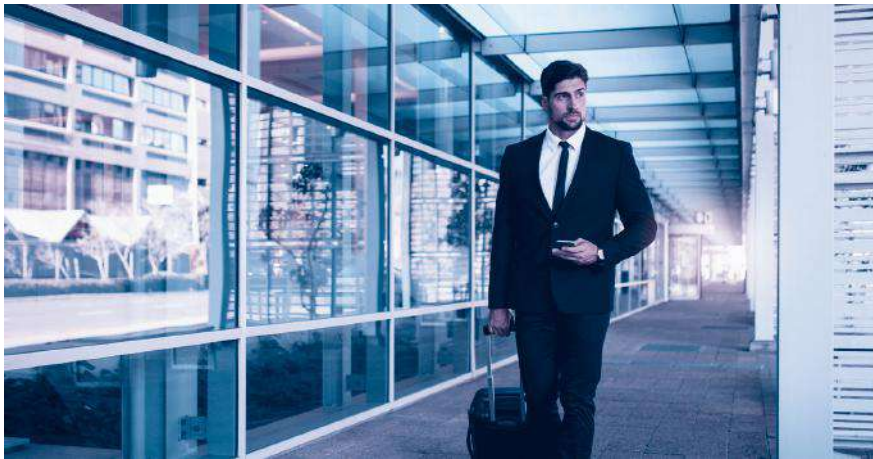
A1-Bescheinigung dabei? Sie ist für alle Aktivitäten im Ausland nötig.

entrichten hat. Es ist für sämtliche grenzüberschreitenden Tätigkeiten nötig, beispielsweise für Berater, Künstler, Journalisten oder Mitarbeiter im Transport oder Baugewerbe, und zwar auch dann, wenn der Aufenthalt nur wenige Stunden beträgt. Ausgestellt wird die A1-Bescheinigung von der AHV-Ausgleichskasse im Wohnsitzland des betroffenen Arbeitnehmers, beantragt wird sie vom Arbeitgeber des Entsandten bzw. direkt vom Selbständigerwerbenden.